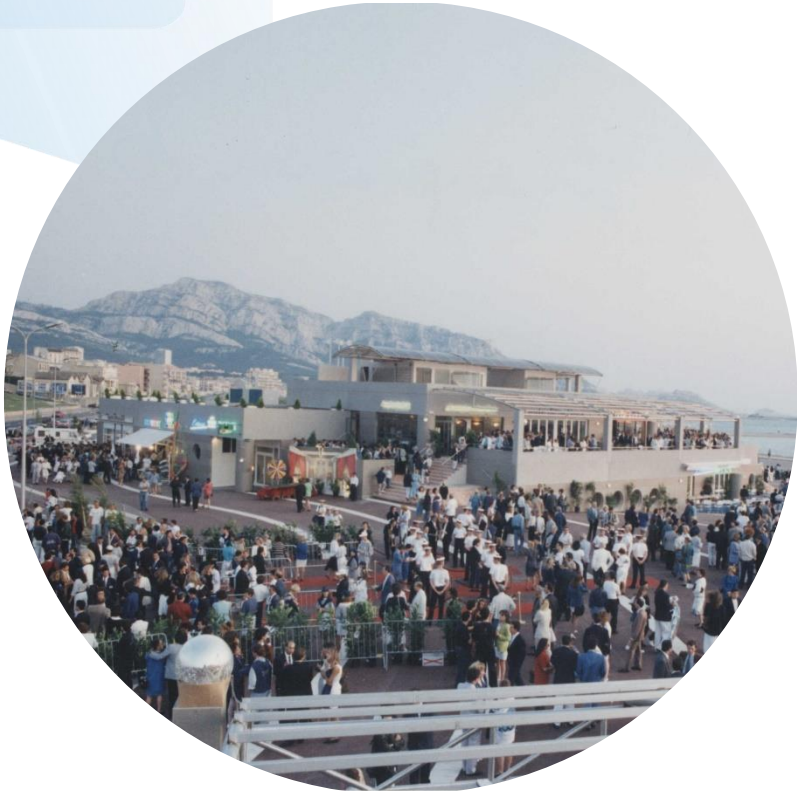
Inauguration du 26 avril 1992

Au cœur du 8 e arrondissement de Marseille, l'Escale Borély a été construite dans les années 1990 et fut inaugurée en avril 1992.